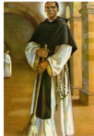
SAN MARTIN DE PORRES "NO HAY GUSTO MAYOR QUE DAR A LOS POBRES"

17:30pm Conclusiones, compromisos y elección del lugar del próximo EPA.