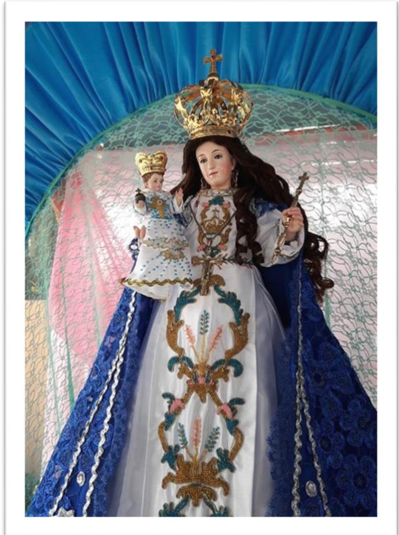
NUESTRA SEÑORA DE CHILLA PATRONA DE LA DIÓCESIS DE MACHALA

Bendita sea la divina sabiduría, que fortalece nuestra fe por los dones que ha infundido y está presente en nuestros pueblos afrodescendientes que supieron superar la experiencia dolorosa de la esclavitud, formando comunidades originales, libres, palenques, cumbes o palmares, las cuales ayudaron a edificar la identidad de estos pueblos.