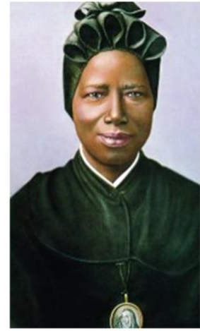
SANTA JOSEFINA BAKHITA RELIGIOSA DE SUDÁN Y HERMANA UNIVERSAL

SANTA JOSEFINA BAKHITA: narra unos de sus recuerdos más terroríficos como esclava: el día en el que, junto a otros esclavos, fue marcada mediante un proceso parecido a la escarificación y que se practica tradicionalmente en algunas regiones de Sudán. Este consistía en marcar sobre su piel patrones de líneas con harina blanca, mientras su ama la observaba con el látigo en la mano, que luego eran repasados con una cuchilla, dejando profundos surcos que luego rellenaba con sal para evitar que cicatrizaran. A Bakhita le realizaron un total de 114 dibujos sobre todo el cuerpo, menos en el rostro, ya que sus amas la consideraban bonita